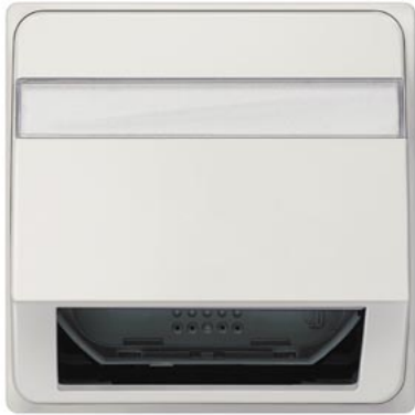
DELTA style titanweiß Schrägauslass für Lichtwellenleiter 68x68mm