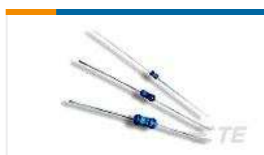
TE Teilenummer1622698-1 LR2 1% 18K