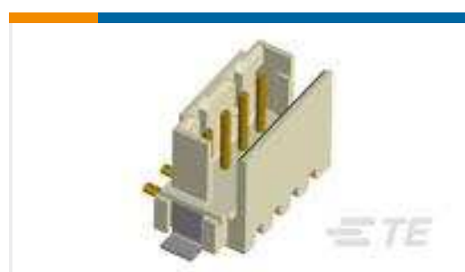
TE Teilenummer292175-6 CT BOX HDR V SMT 6P O/TAPE NAT