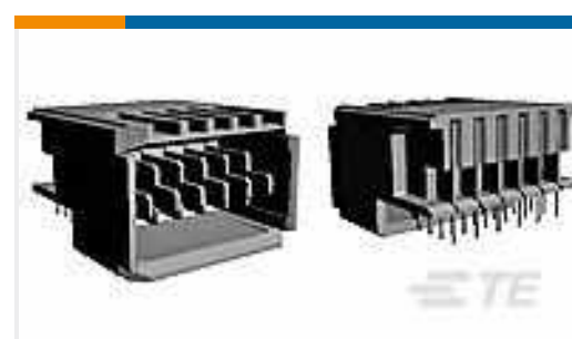
TE Teilenummer120957-1 UPM EXPANDED PIN ASSEMBLY