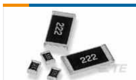
TE Teilenummer7-1879501-3 CRGH2512 5% 1K0 2W