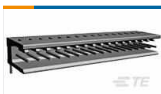
TE Teilenummer826468-3 3P MOD II SHROUDED HEADER, RT ANG.