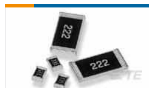
TE Teilenummer3-1879501-3 CRGH2512 5% 22R 2W