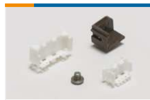
Montage von Leiterplatten- Steckverbindern(46)