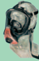
Ultra Elite-PS m. Transponder 10026552