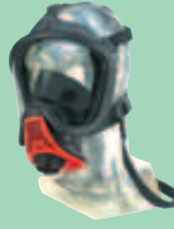
Ultra Elite-PS-EZ D2056772