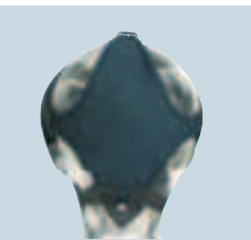
EZ [Easy-Don] Nomex-Bänderung