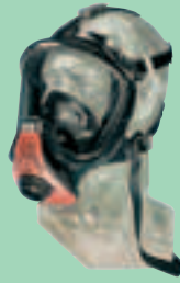
Ultra Elite-PS D2056751