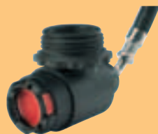
LA 96-AE D4075851