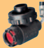
LA 88-AS D4075906