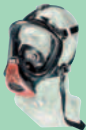
Ultra Elite-PF D2056741

Vollmasken für Zweiwegatmung, mit federbelastetem Ausatemventil. Für Pressluftatmer und Druckluft-Schlauchgeräte mit entsprechendem Überdruck-Lungenautomaten.