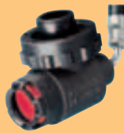
LA 96-AS D4075850