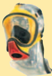
Ultra Elite-PF-Silikon D2056763