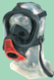
Ultra Elite-PF-EZ D2056771