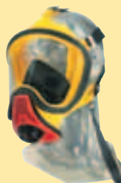
Ultra Elite-PS-Silikon D2056764