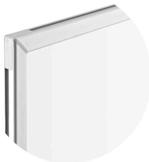
Vue détaillée du cadre de profil