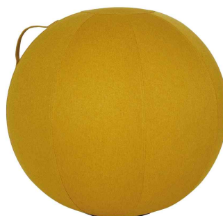
Ballon d'assise ergonomique "MHBALL", jaune safran