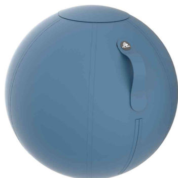
Ballon d'assise ergonomique "MHBALL", bleu canard