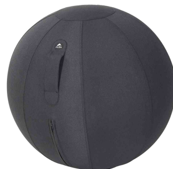
Ballon d'assise ergonomique "MHBALL", noir