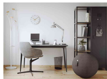
Visuel de référence; présente le produit en utilisation