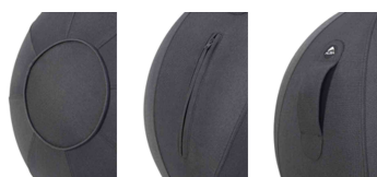
Vue détaillée: fonction Tumbler - fermeture éclair - poignée