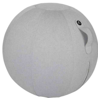
Ballon d'assise ergonomique "MHBALL", gris clair