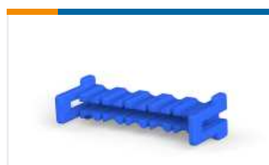
TE Teilenummer2-1971904-5 TPA 10POS,NEW GIC3.3