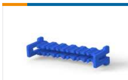
TE Teilenummer2-1971904-6 TPA 12POS,NEW GIC3.3