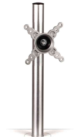
Zubehör: TFT-/LCD-Monitorarm Lotus