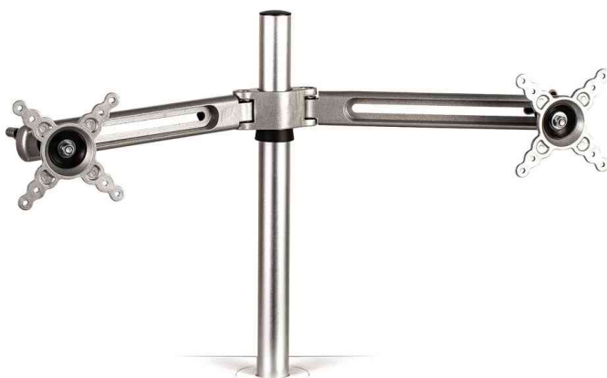
Zubehör: TFT-/LCD-Doppel-Monitorarm Lotus