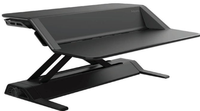
Sitz-Steh Workstation Lotus