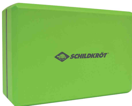
Bloc de yoga, vert