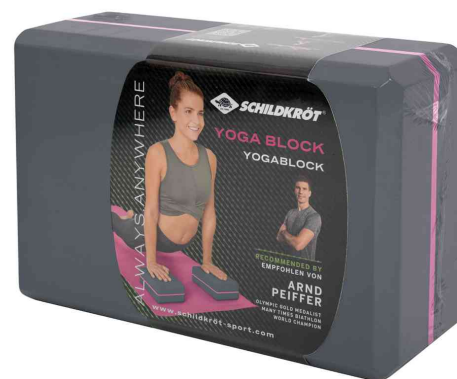
Visuel de référence : emballage