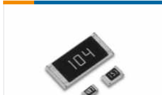
TE Teilnr.:4-2176345-9 CRGCQ 1210 100K 1%