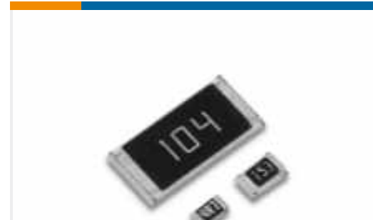
TE Teilnr.:2-2176345-9 CRGCQ 1210 2K2 1%