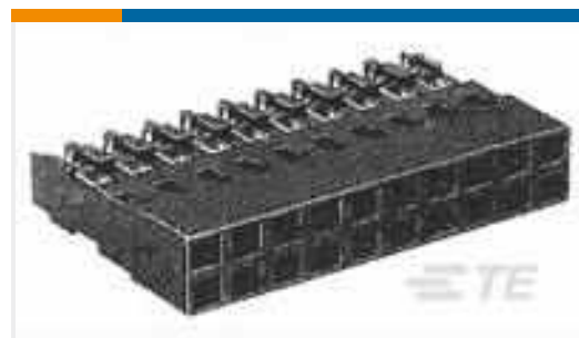
TE Teilnr.:3-5102935-6 LEVEL V ASSY DR .125CL, 40, LE