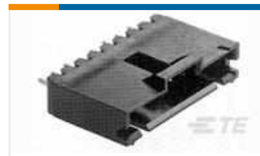
TE Teilnr.:6-104910-3 14 MTE HDR SRST LATCH .100CL