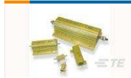
TE Teilnr.:2-1625984-5 HSA50 1R2 5%