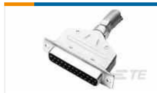
TE Teilnr.:747516-9 KIT,RCPT,9P,HDE,SHLD HDWRE