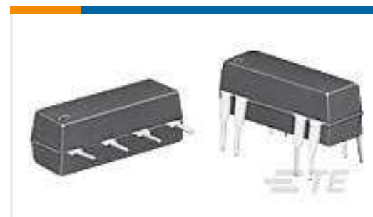
TE Teilnr.:1-1393771-6 JWD-171-24=REED RELAYS