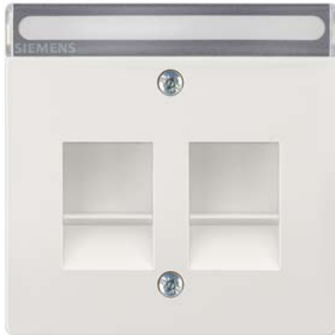
DELTA style titanweiß Abdeckung mit Modular Jack, Schriftfeld, Verschlusschieber 68x68mm