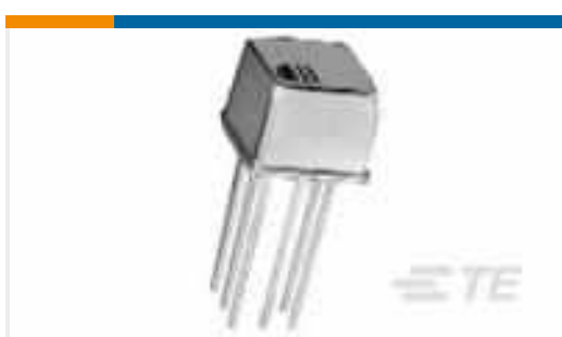
TE Teilnr.:2-1617146-7 JMGACDD-26L = M39016/19-036L