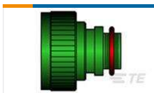
TE Teilnr.:680309-000 TXR54AC00-1204AI