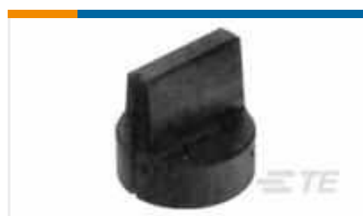
TE Teilnr.:6-1437621-7 KCB900B1/4=KNOB BAR BLACK 1/4