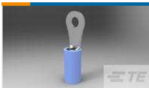
TE Teilnr.:8-328996-1 TERMINAL,PIDG R 16-14 4