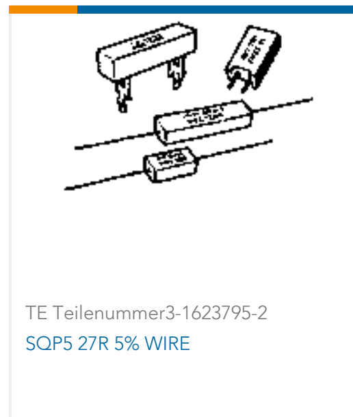
TE Teilenummer3-1623795-2 SQP5 27R 5% WIRE