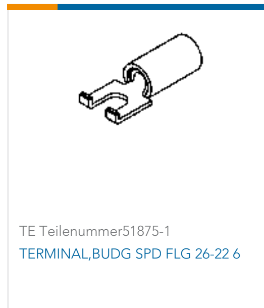
TE Teilenummer51875-1 TERMINAL,BUDG SPD FLG 26-22 6