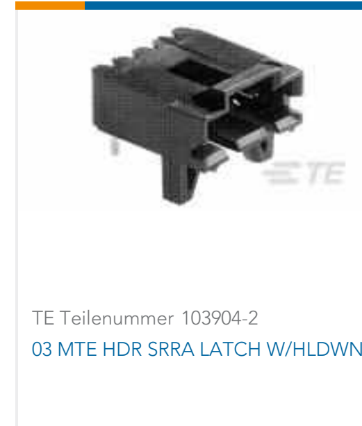
TE Teilenummer 103904-2 03 MTE HDR SRRA LATCH W/HLDWN