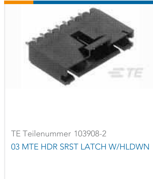
TE Teilenummer 103908-2 03 MTE HDR SRST LATCH W/HLDWN