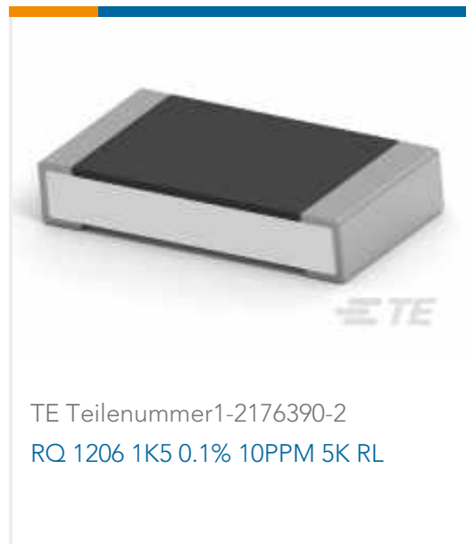
TE Teilenummer1-2176390-2 RQ 1206 1K5 0.1% 10PPM 5K RL