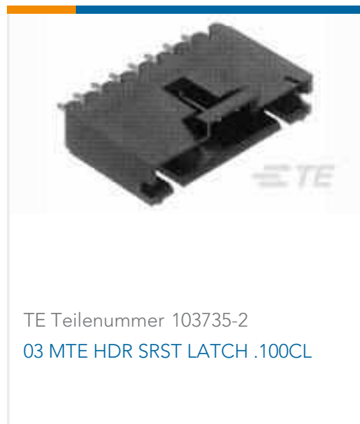
TE Teilenummer 103735-2 03 MTE HDR SRST LATCH .100CL