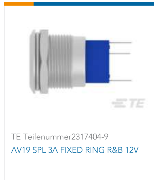
TE Teilenummer2317404-9 AV19 SPL 3A FIXED RING R&B 12V