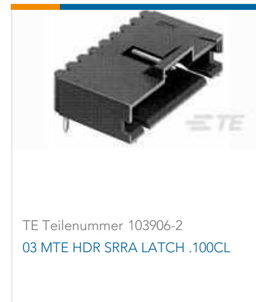
TE Teilenummer 103906-2 03 MTE HDR SRRA LATCH .100CL