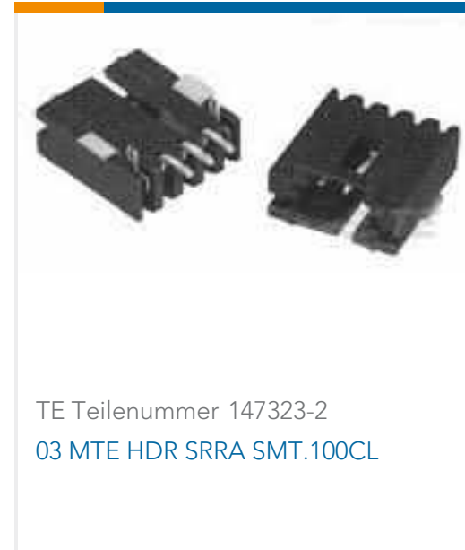
TE Teilenummer 147323-2 03 MTE HDR SRRA SMT.100CL