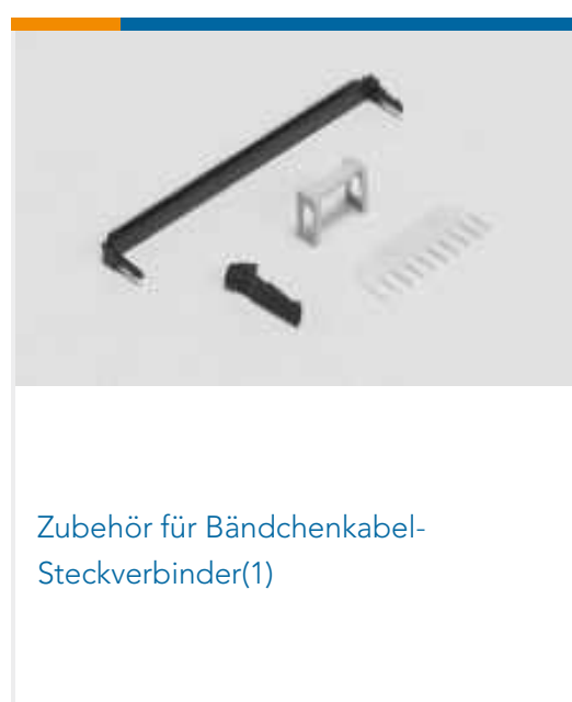
Zubehör für Bändchenkabel- Steckverbinder(1)