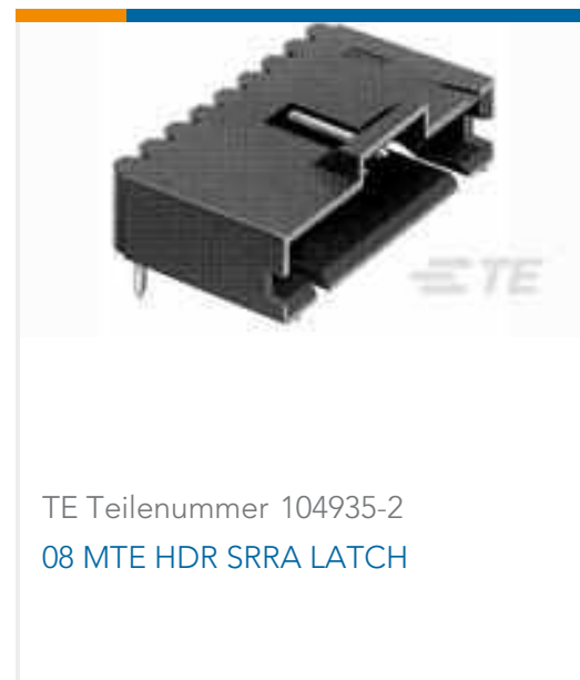
TE Teilenummer 104935-2 08 MTE HDR SRRA LATCH