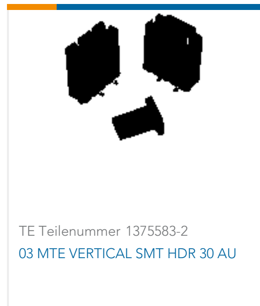
TE Teilenummer 1375583-2 03 MTE VERTICAL SMT HDR 30 AU