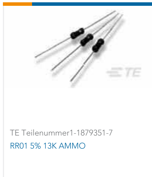
TE Teilenummer1-1879351-7 RR01 5% 13K AMMO