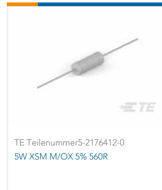
TE Teilenummer5-2176412-0 5W XSM M/OX 5% 560R