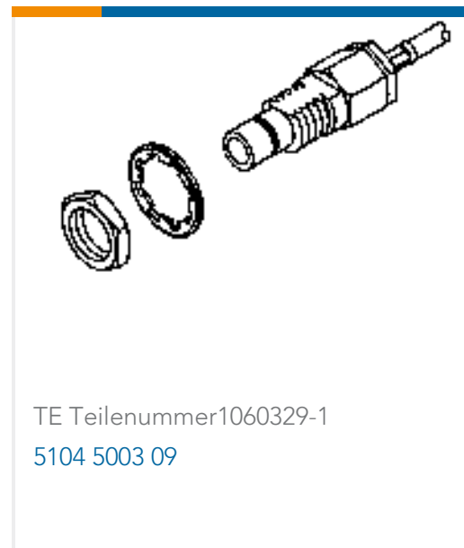
TE Teilenummer1060329-1 5104 5003 09