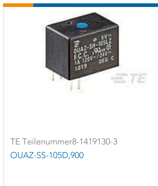
TE Teilenummer8-1419130-3 OUAZ-SS-105D,900