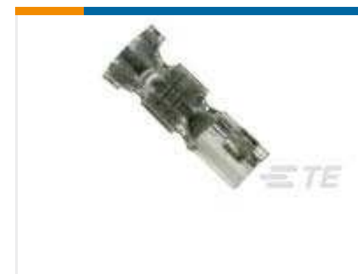
TE Teilenummer 179227-4 AMP CT CRIMP-2 REC CONT AU