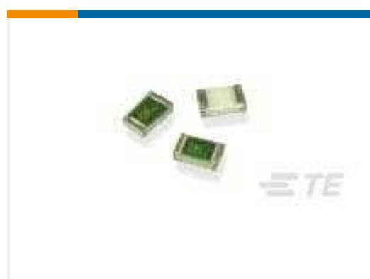
TE Teilenummer1-1676731-5 RN 0805 4K75 0.1% 5PPM 1K RL