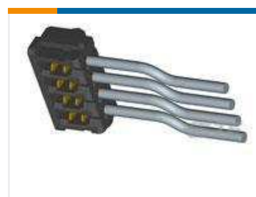
TE Teilenummer 2-179694-6 CT MT REC ASSY 6P GRAY