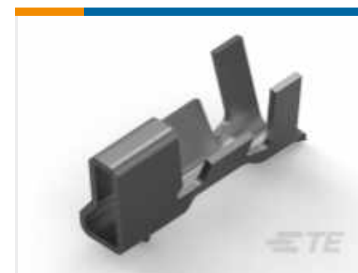
TE Teilenummer 179227-1 CRIMP TYPE II REC CONTACT