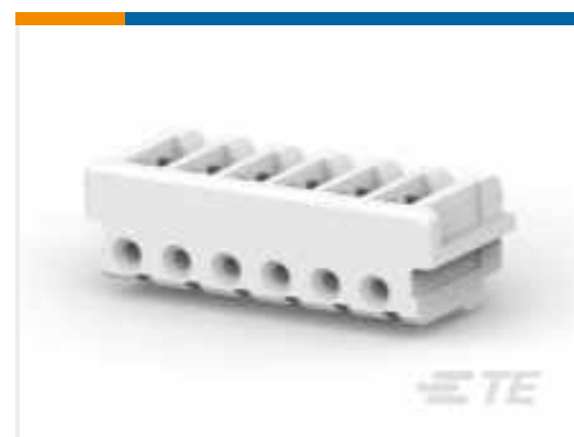
TE Teilenummer 173977-6 CT CONN MT REC ASSY 6P