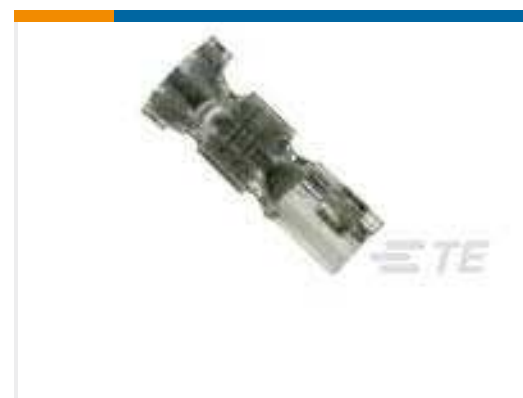
TE Teilenummer 179518-1 CT CRIMP-2 REC CONT. L/P