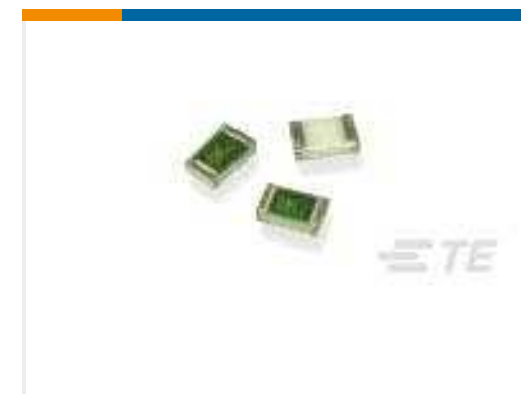
TE Teilenummer3-1676731-3 RN 0805 3K3 0.1% 5PPM 1K RL