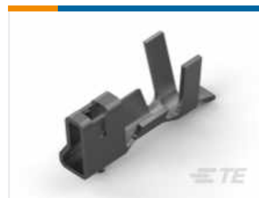
TE Teilenummer 179609-1 AMP CT CRIMP TTYPE-2 REC CONT.