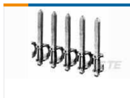
TE Teilenummer5-103577-3 MACH APL BAND W/POST 30 DPLX, ROHS