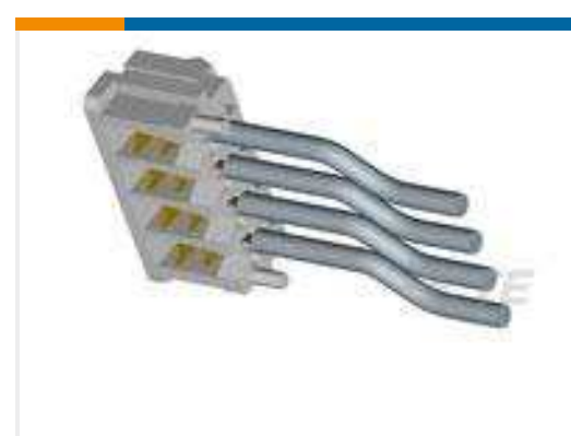
TE Teilenummer 2-173977-6 CT CONN MT REC ASSY 6P BLUE