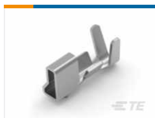
TE Teilenummer 179610-1 AMP CT CRIMP-2 REC CONT. L/P