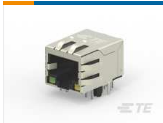
TE Teilenummer2301994-9 RJ45 JACK INT.MAG. 10/100 LED 1X1