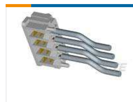
TE Teilenummer 4-173977-6 CT CONN MT REC ASSY 6P YELLOW