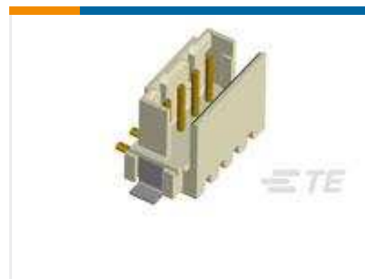
TE Teilenummer292175-5 CT BOX HDR V SMT 5P O/TAPE NAT