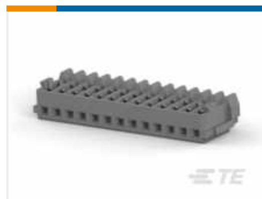
TE Teilenummer 1-353293-3 MINI CT MT REC ASSY 13P GRAY