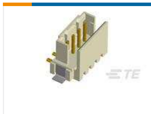
TE Teilenummer292175-8 CT BOX HDR V SMT 8P O/TAPE NAT