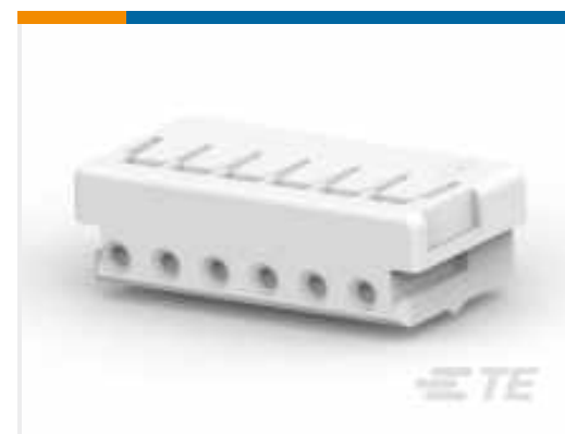
TE Teilenummer 179228-6 CRIMP TYPE II RECPT HSG