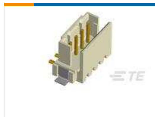
TE Teilenummer292175-4 CT BOX HDR V SMT 4P O/TAPE NAT