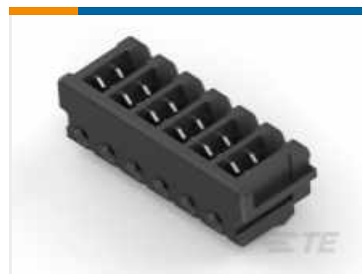
TE Teilenummer 6-173977-6 CT CONN MT REC ASSY 6P BLACK