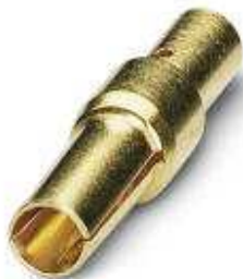
Crimpkontakt, gedreht, Einzelkontakt, Kontaktdurchmesser: 1 mm, Crimpbereich: 0,08 mm 2 ... 0,22 mm 2

Bitte beachten Sie, dass die hier angegebenen Daten dem Online-Katalog entnommen sind. Die vollständigen Informationen und Daten entnehmen Sie bitte der Anwenderdokumentation. Es gelten die Allgemeinen Nutzungsbedingungen für Internet-Downloads. ( http://phoenixcontact.de/download )