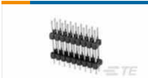
TE Teilenummer827988-5 2X 5P MOD2 PIN HEADER