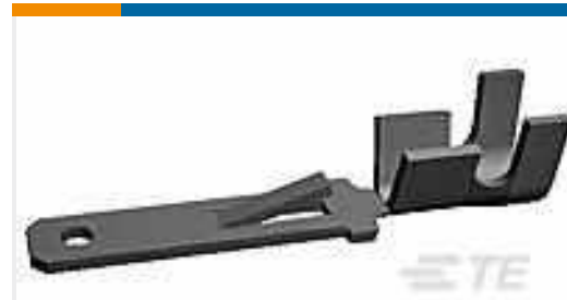
TE Teilenummer962825-2 FF 250 TAB 24-20 AWG .016 TPPB