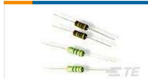
TE Teilenummer2-1623720-4 CCR2 15R 10%