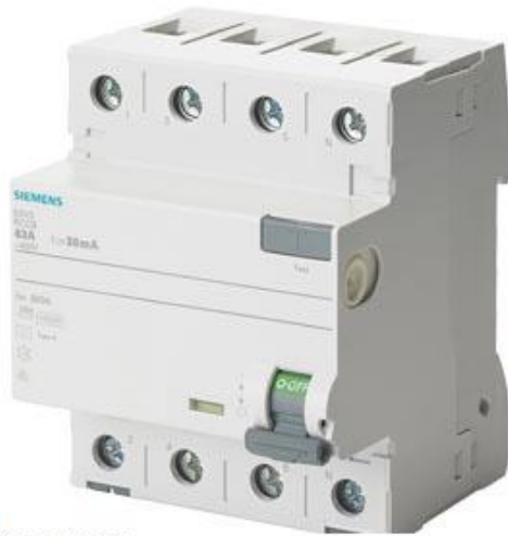
FI-SCHUTZSCHALTER TYP A 63A 3+N-POL 30MA 400V 4TE