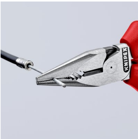
Rainurage fraisé dans la zone de saisie