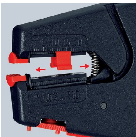
12 40 200: Arresto per regolazione della lunghezza

Con riserva di modifiche tecniche e salvo errori