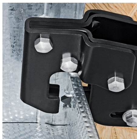
Ustawienie narzędzia do wykonania połączenia