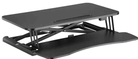
Station de travail électrique assis-debout avec support clavier