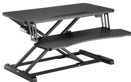
Station de travail électrique assis-debout avec support clavier