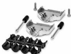
Kabelgehäuse für D-SUB-15

Bitte beachten Sie, dass die in diesem PDF-Dokument angezeigten Daten aus unserem Online-Katalog generiert wurden. Bitte finden Sie die vollständigen Daten in der Benutzer-Dokumentation. Es gelten unsere Allgemeinen Nutzungsbedingungen für Downloads.