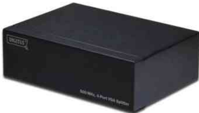
VGA Splitter 500 MHz, 4-fach

Anwendungsbeispiel: - für den Einsatz von digitalen Medieninhalten bei Werbe- und Informationssystemen (Digital Signage)- für den Einsatz von visuellen Informationen, z.B. an Flughäfen, Bahnhöfen, für Klassenräume und Schulungseinrichtungen und überall dort, wo mehrere Menschen dieselben Informationen benötigen