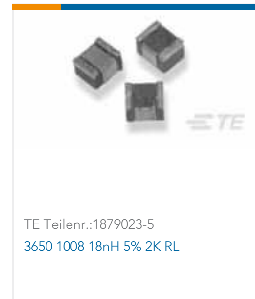
TE Teilnr.:1879023-5 3650 1008 18nH 5% 2K RL