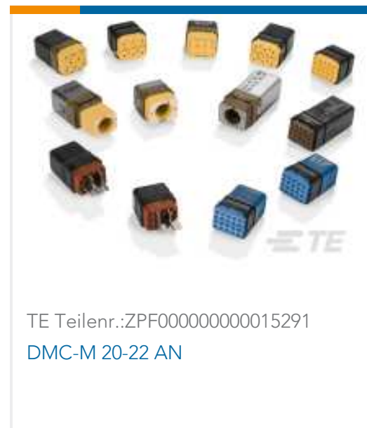
TE Teilnr.:ZPF000000000015291 DMC-M 20-22 AN