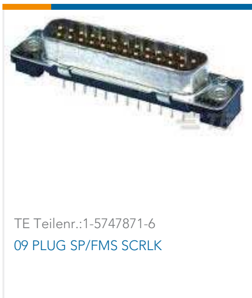
TE Teilnr.:1-5747871-6 09 PLUG SP/FMS SCRLK