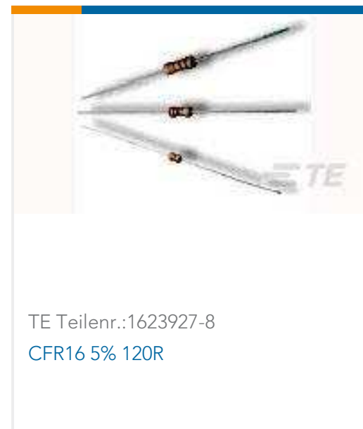
TE Teilnr.:1623927-8 CFR16 5% 120R