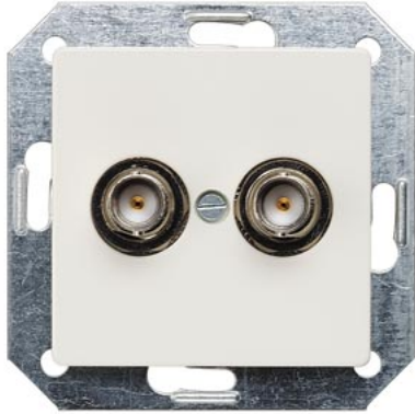
DELTA i-system titanweiß BNC-Steckbuchse 2-fach 75 Ohm 55x55mm