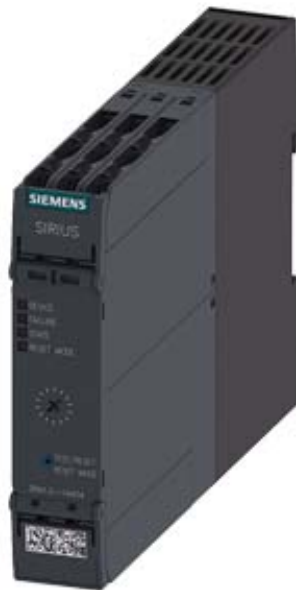
MOTORSTARTER SIRIUS 3RM1 WENDESTARTER 500 V, 0,1-0,5A, 24V DC SCHRAUBANSCHLUSSTECHNIK