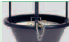
Sicherung durch Kette und Schloß