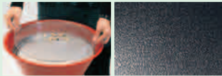
Quarz-Silbersand, 1 VE = 25 kg