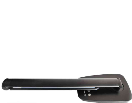
Vue détaillée : pliable pour un gain de place