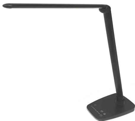
Lampe de bureau à LED TWISTLED