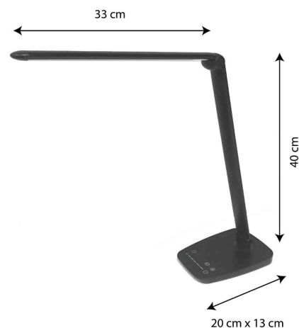
Vue détaillée : dimensions