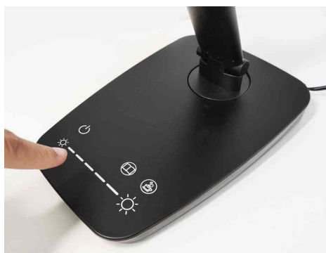
Vue détaillée : socle