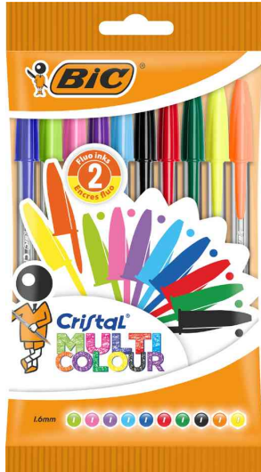
Kugelschreiber Cristal Large Multicolor, 10er Beutel