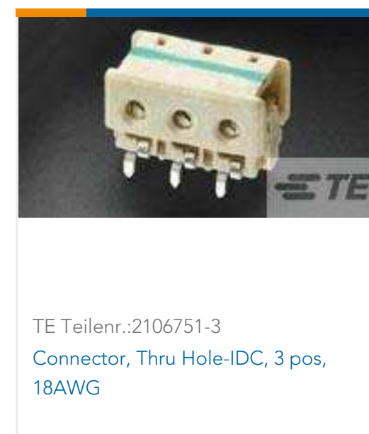
TE Teilnr.:2106751-3 Connector, Thru Hole-IDC, 3 pos, 18AWG