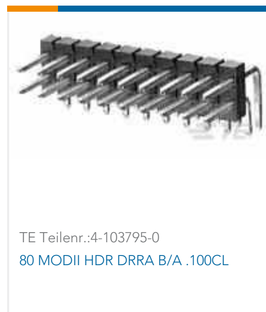
TE Teilnr.:4-103795-0 80 MODII HDR DRRA B/A .100CL