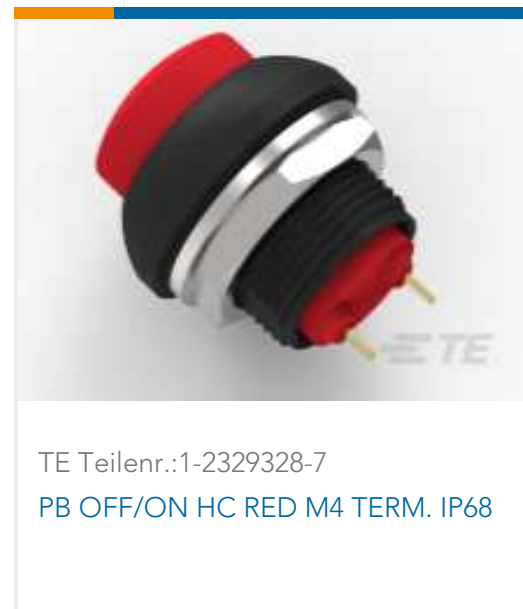
TE Teilnr.:1-2329328-7 PB OFF/ON HC RED M4 TERM. IP68