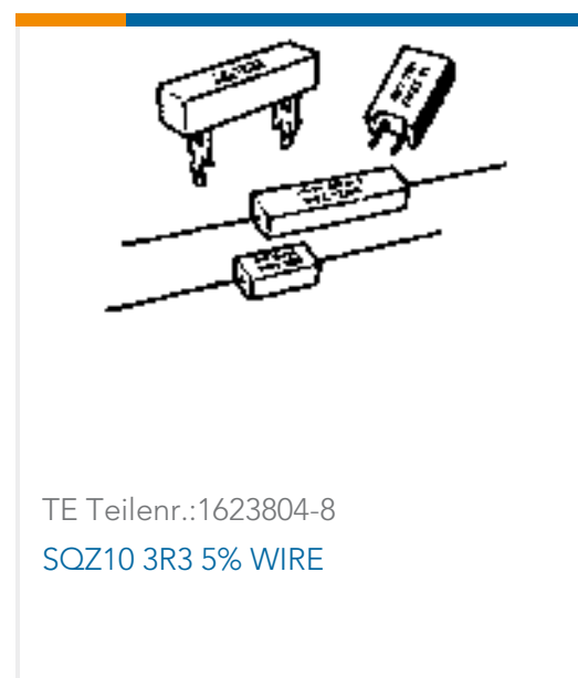
TE Teilnr.:1623804-8 SQZ10 3R3 5% WIRE