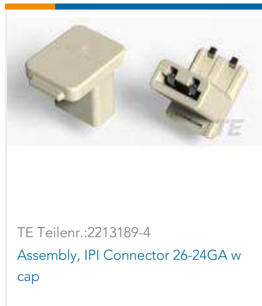
TE Teilnr.:2213189-4 Assembly, IPI Connector 26-24GA w cap