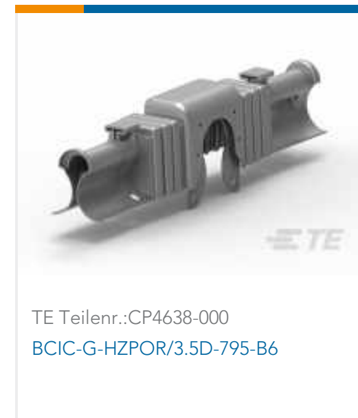
TE Teilnr.:CP4638-000 BCIC-G-HZPOR/3.5D-795-B6