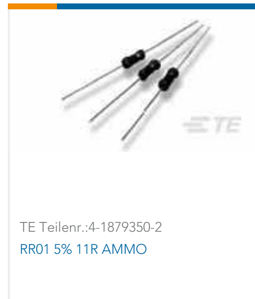
TE Teilnr.:4-1879350-2 RR01 5% 11R AMMO