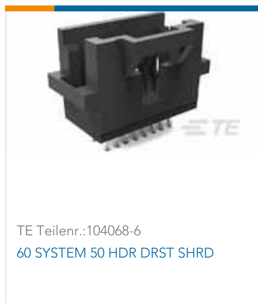
TE Teilnr.:104068-6 60 SYSTEM 50 HDR DRST SHRD