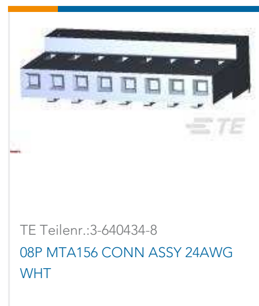
TE Teilnr.:3-640434-8 08P MTA156 CONN ASSY 24AWG WHT