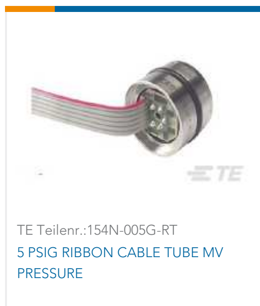
TE Teilnr.:154N-005G-RT 5 PSIG RIBBON CABLE TUBE MV PRESSURE