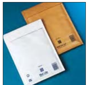
Mail Lite® Luftpolster-Versandtaschen