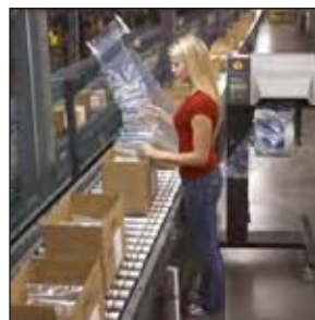
Fill-Air® 2000 Luftbeutel-Verpackungssystem