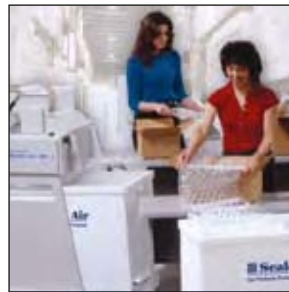
NewAir I.B.™ 200 Verpackungssysteme