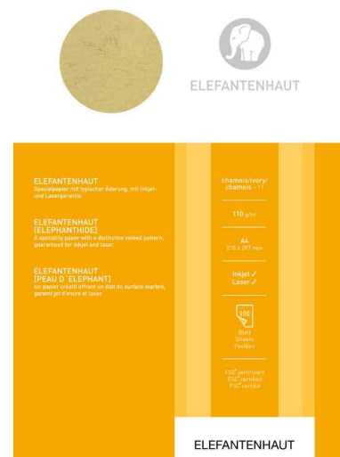
Visuel de référence: Peau d'éléphant, chamois