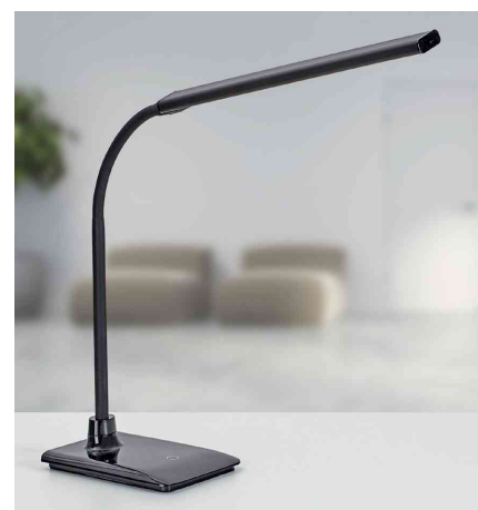
Visuel de référence : présente le produit en utilisation