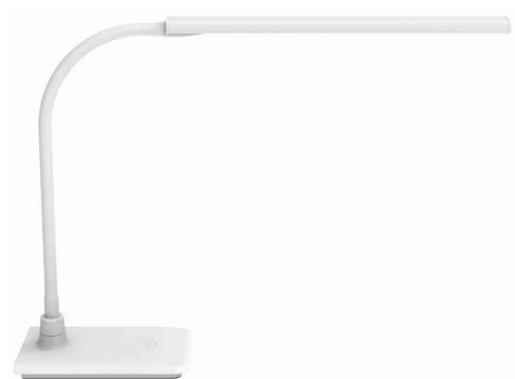
Lampe de bureau à LED MAULpirro, blanc