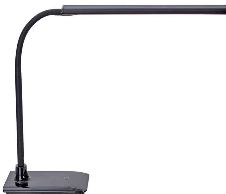
Lampe de bureau à LED MAULpirro, noir