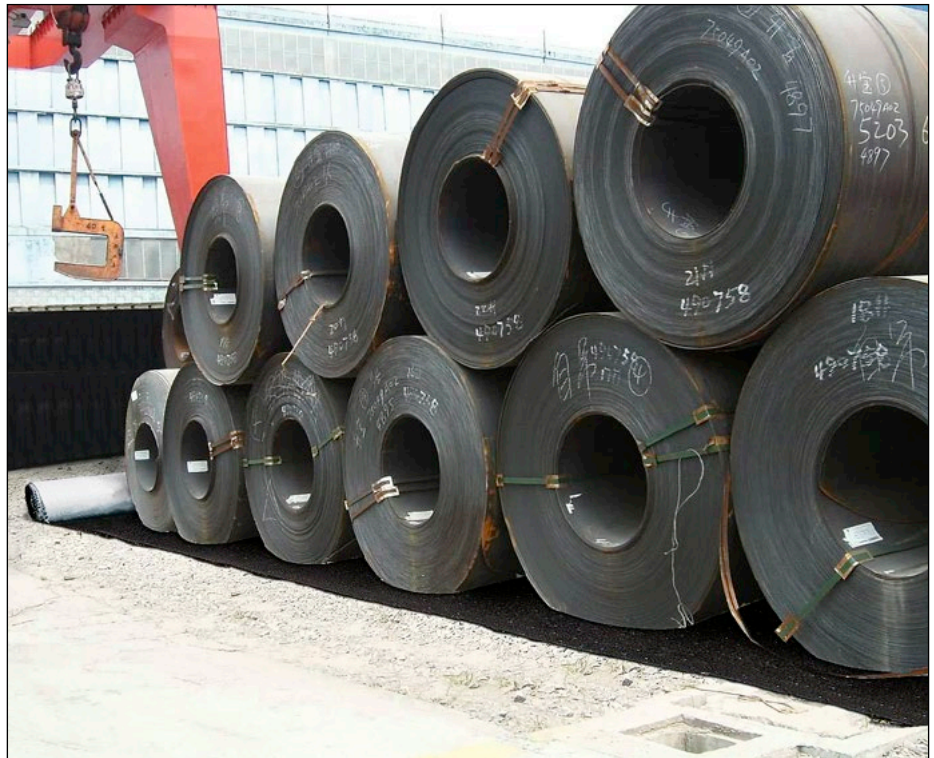
Anwendung als Unterlage zum Schutz des Bodens: Die Outdoor Matten nehmen Öl, aber kein Wasser auf.