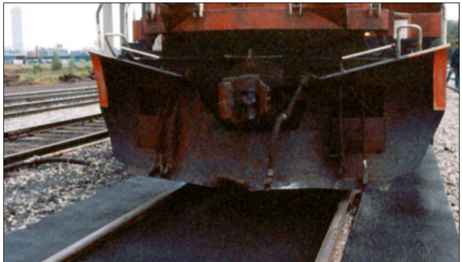
Anwendung bei Reparatur- und Wartungsarbeiten: der Untergrund bleibt sauber und geschützt.