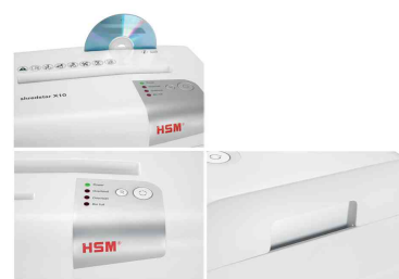
Détails: bloc de coupe séparé pour CD - bouton d'utilisation - partie supérieure amovible