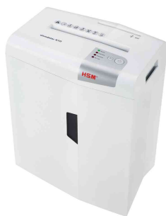
Destructeur de documents HSM shredstar X10