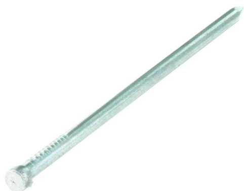
Visuel de référence: tête d'homme, galvanisée