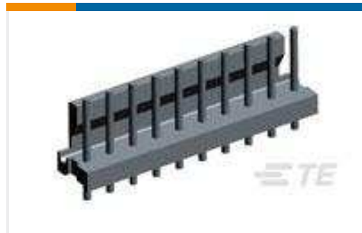
TE Teilnr.:1-640388-0 10P MTA156 HDR ASSY RN STR F/L