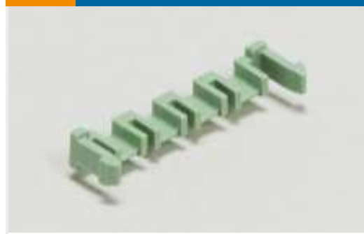
Laschen, Verriegelungen und Arretierungen für Leiterplatten(1)