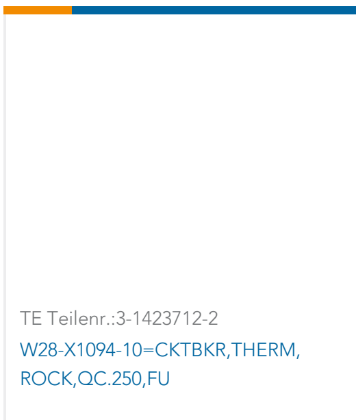
TE Teilnr.:3-1423712-2 W28-X1094-10=CKTBKR,THERM, ROCK, QC.250,FU