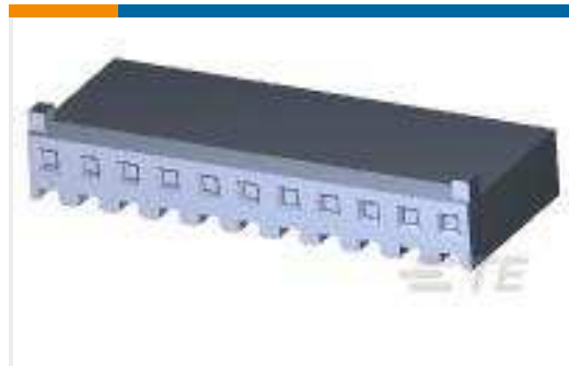
TE Teilnr.:1-770849-1 11P SL156 HSG W/LCK RMP & TABS