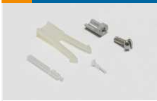
Kodierungen für Leiterplatten-Steckverbinder(2)