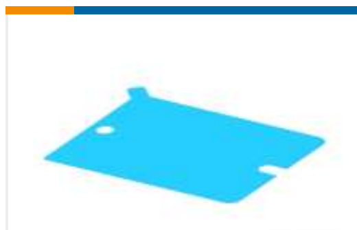
TE Teilnr.:2323803-1 SSR-ACC-TH-001 = Thermal pad 1 phase