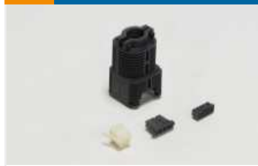
Rechteckige Steckverbindergehäuse (11)