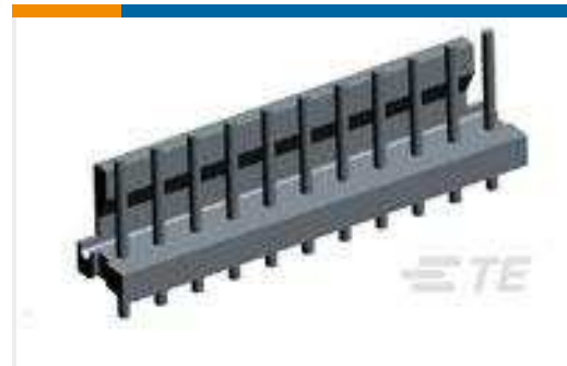
TE Teilnr.:1-640388-1 11P MTA156 HDR ASSY RN STR F/L