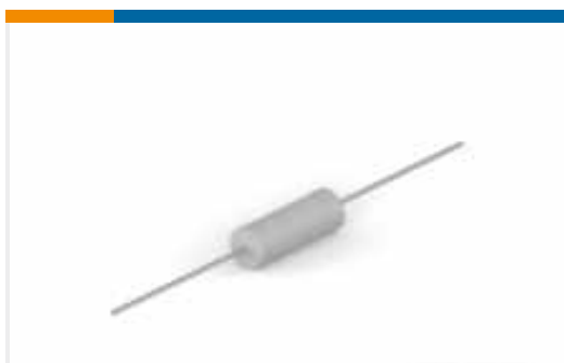
TE Teilnr.:8-2176412-7 5W XSM M/OX 5% 20K