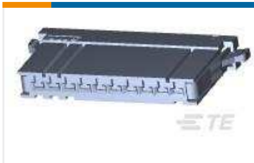
TE Teilnr.:1-178288-8 DYNAMIC 3100 REC HSG 10P