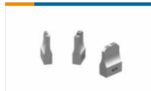
ANVIL REPRESENTATION ONLY TE Teilnr.:1803131-2 ANVIL-SPLICE TYPE