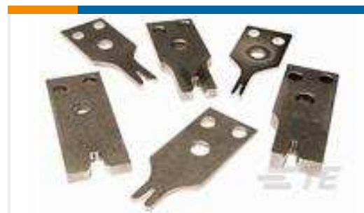
TE Teilnr.:3-2119784-7 CRIMPER, INSULO PREMIUM