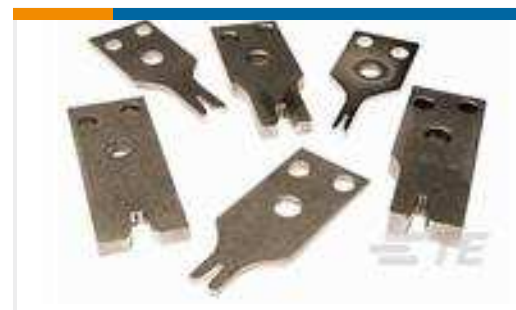
TE Teilnr.:9-2119582-0 CRIMPER, INSULATION F PREMIUM