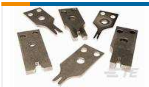
TE Teilnr.:3-2119784-6 CRIMPER, INSULATION