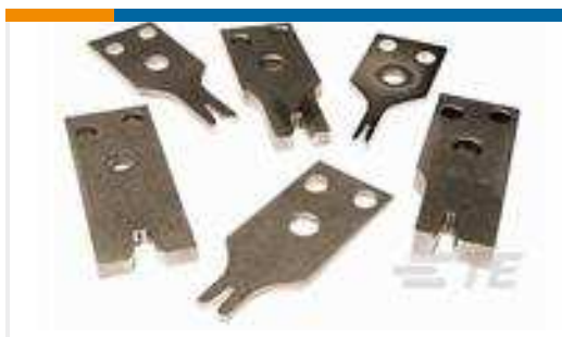
TE Teilnr.:1-2119582-0 Crimper, Insulation F Premium