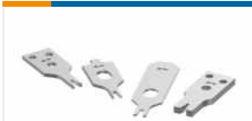
CRIMPER REPRESENTATION ONLY TE Teilnr.:1803323-5 CRIMPER, WIRE, F PREMIUM