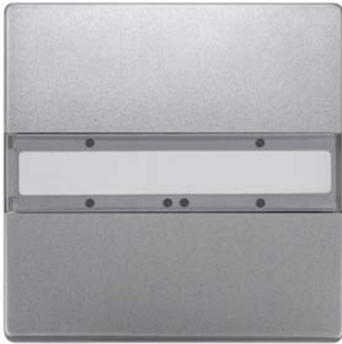
GAMMA INSTABUS TASTER 1-FACH UP 285/2 DELTA STYLE PLATINMETALLIC