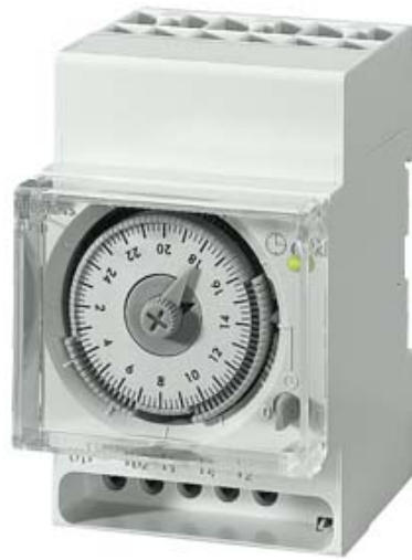
QUARZ-SCHALTUHR TAG 1 WECHSLER 230V/50-60HZ 3TE AUTO.SOWI UMSCHALTUNG