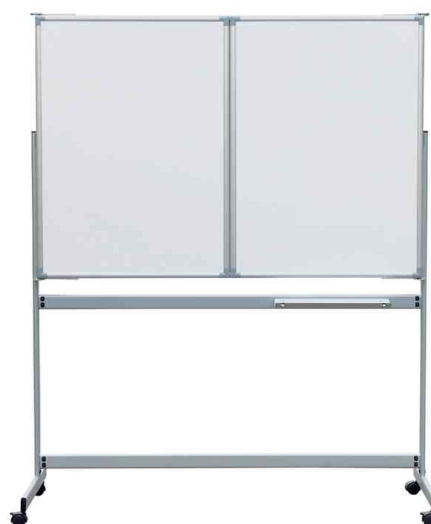
Mobile Weißwand-Klapptafel MAULpro, geschlossen