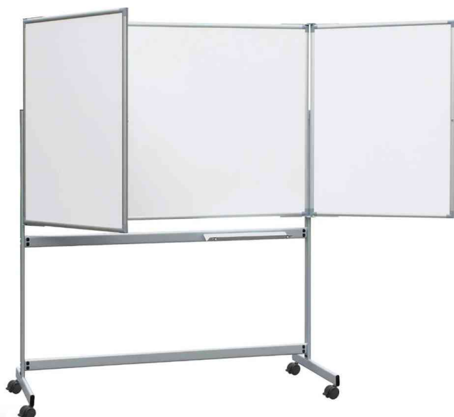
Mobile Weißwand-Klapptafel MAULpro

Tafelgröße 1.000 x 1.500 mm, Flügel jeweils 1.000 x 750 mm. Außenmaß geschlossen: 1.580 x 1.950 x 650 mm