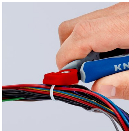
Elimine la parte superior de la brida de cable con el alicate de corte diagonal para electrónica...