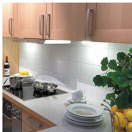
Fliesenkleben sauber und perfekt in einer Küchezeile.