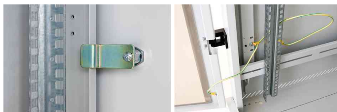
Befestigungsteil und Schlossteil der abnehmbaren Rückwand