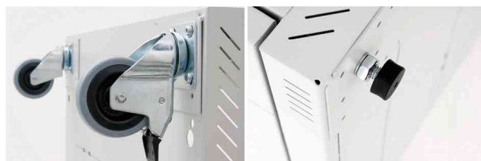
Montagemöglichkeit für Rollen oder Nivellierfüße