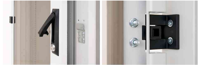
Schwenkhebelgriff - flexible Türöffnung