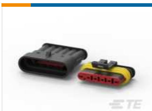
TE Teilnr.:282104-1 AMP SUPERSEAL 1.5MM, STECKVERBINDERGEHÄUSE