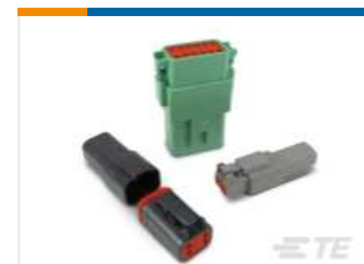
TE Teilnr.:DT04-2P DEUTSCH DT Serie Gehäuse und Steckverbinder