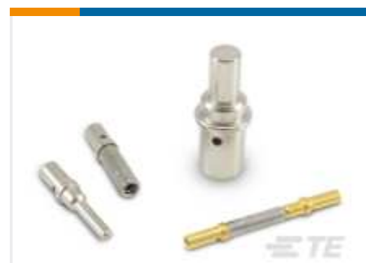
TE Teilnr.:0460-202-16141 MASSIVE DEUTSCH KONTAKTE