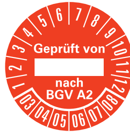
PRP 35-31 RT