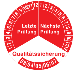
PRP 35-25 RT

Sonderanfertigung mit Firmenzeichen oder angepaßten Prüfintervalen sind möglich. Individuelle Erstellung von Prüfplaketten siehe auch PPT für Thermotransferdrucker Seite 44.