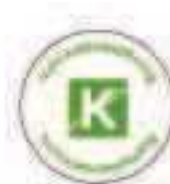
PRP 20-24 GN

PRP's auch in der entsprechenden Jahresfarbe (siehe Seite 65) auf Anfrage lieferbar.