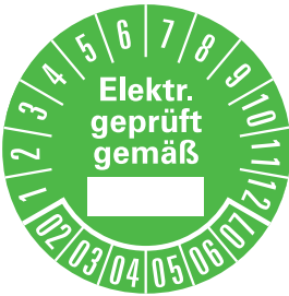
PRP 35-27 GN