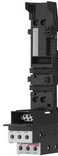
TERMINALMODUL FUER ET 200S DS FUER DIREKTSTARTER MIT ZULEITUNGSANSCHLUSS