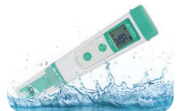
IP67 wasser- und staubdicht