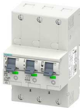
Hauptleitungsschutzschalter (SHU), 3x 1-polig, E 20, 400V