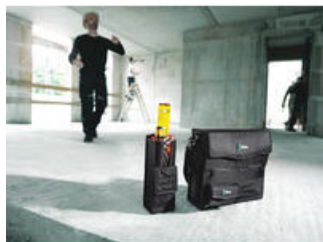
Wera 2go 7 Werkzeug-Hochbox.