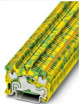
1,5 (1,5) mm 2 , Schutzleiterklemme, 2 Anschlüsse